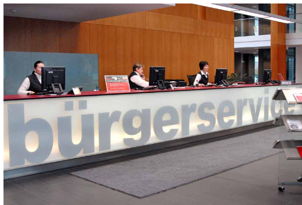
Jederzeit telefonische Auskunftsmöglichkeit, auch in Spitzenzeiten

Die Fabasoft eGov-Suite dient dabei als ECM-System und als Grundlage für die Fachanwendungsintegration, die mittels Java von der Abteilung Informationstechnologie beim Land Oberösterreich entwickelt wurde.